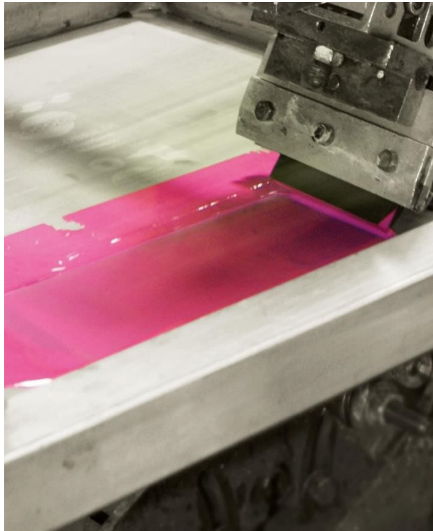
Opløsningsmiddel til rengøring til alle typer trykfarver og lakker, både opløsningsmiddelbaseret eller plantebaseret

iBiotec® Tec Industries® Service Z.I La Massane - 13210 Saint-Rémy de Provence – France Tél. +33(0)4 90 92 74 70 – Fax. +33 (0)4 90 92 32 32 www.ibiotec.fr